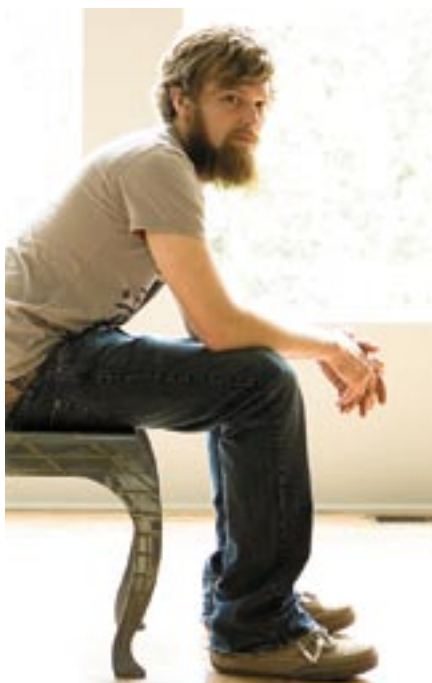
Кол Шего предпочитает свою мебель