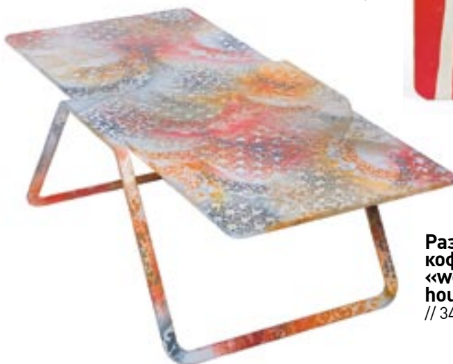
Разноцветный кофейный столик «webs of housewifery table» // 34 863 руб.