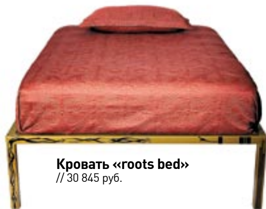
Кровать «roots bed» // 30 845 руб.