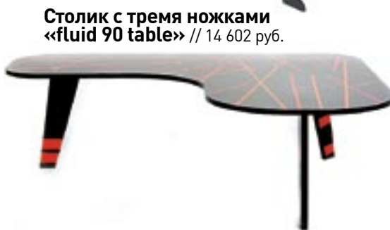
Столик с тремя ножками «fluid 90 table» // 14 602 руб.