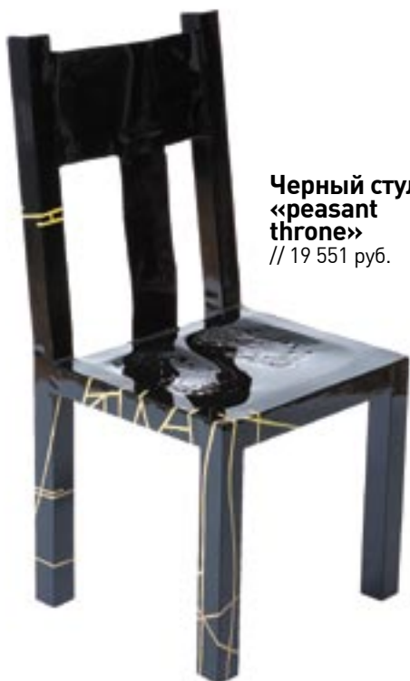
Черный стул «peasant throne» // 19 551 руб.