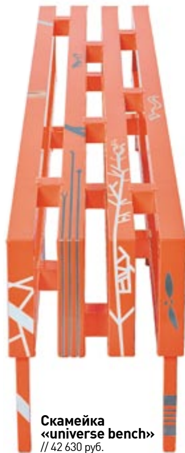
Скамейка «universe bench» // 42 630 руб.