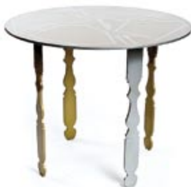
Обеденный стол «a table set for 3 potential victims and an opportunistic murderer» // 43 732 руб.