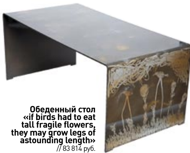
Обеденный стол «if birds had to eat tall fragile flowers, they may grow legs of astounding length» // 83 814 руб.