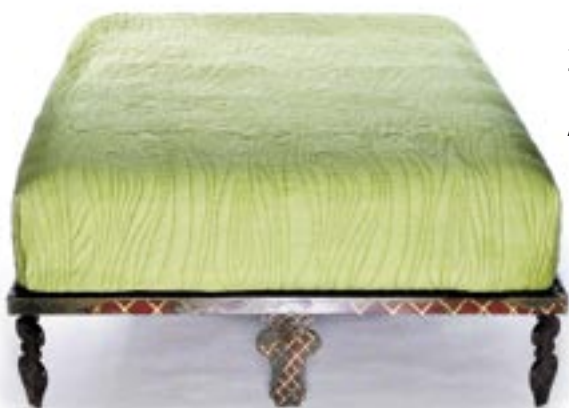
Кровать «minimalistic fancyism sleep platform» // 52 626 руб.