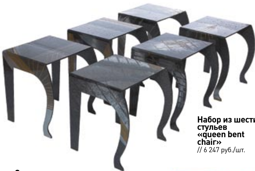
Набор из шести стульев «queen bent chair» // 6 247 руб./шт.