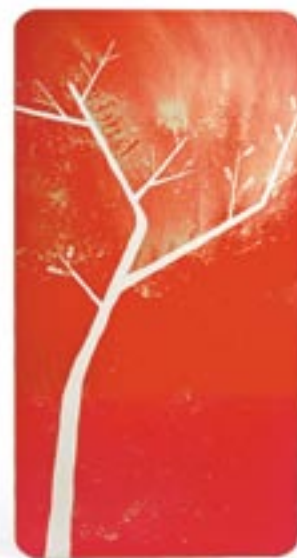
Столешница обеденного стола «a bird is a good spot for a tree table» // 68 281 руб.