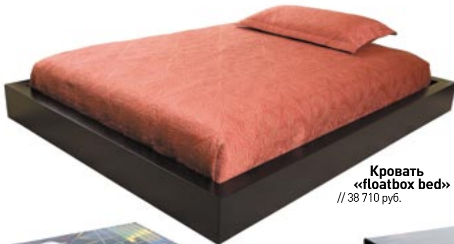
Кровать «floatbox bed» // 38 710 руб.