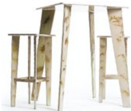
Бело-золотые стол и стулья «a table fit for vodka or other essential vitamins» // 52 724 руб./набор